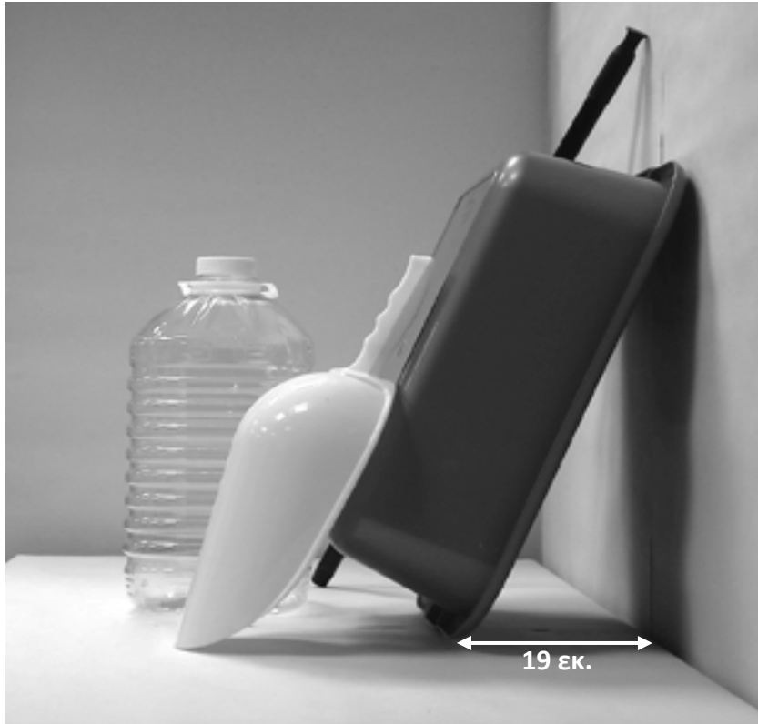
τρίτη φωτογραφία: πλάγια όψη