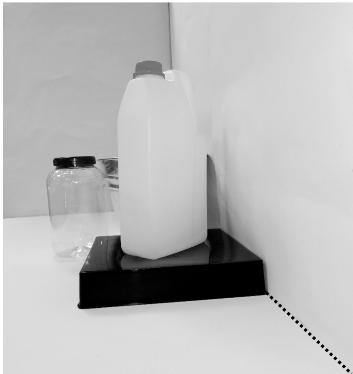
τέταρτη φωτογραφία: πλάγια όψη 2