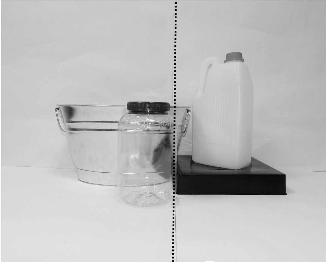
πρώτη φωτογραφία: μπροστινή όψη