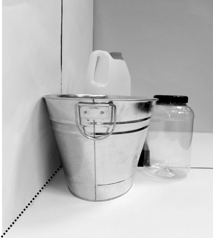
τρίτη φωτογραφία: πλάγια όψη 1